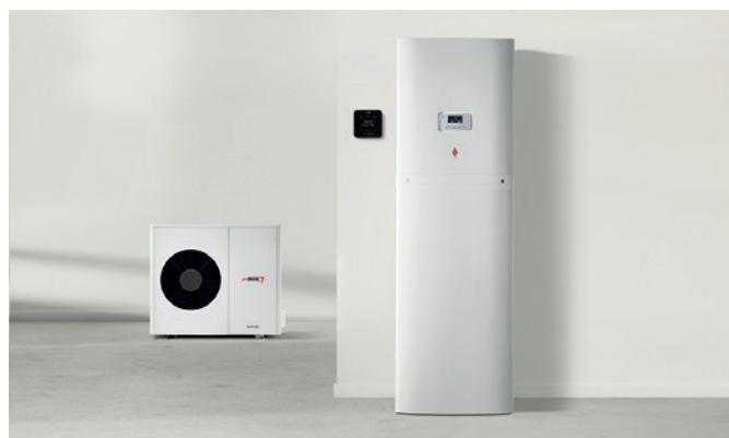
GeniaAir Split, regulátor, GeniaSet Split

Pre zabezpečenie spoľahlivej kvality sa GeniaAir Split vyrába v Európe a každý výrobok je starostlivo testovaný už vo výrobe.